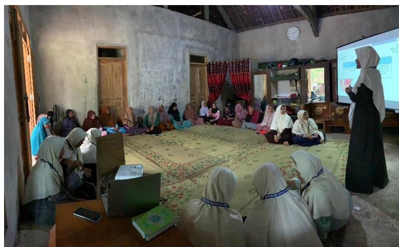
Gambar 1. Pemberian Materi oleh pemateri kedua

Pada tahapan pelaksanaan kegiatan ini dipimpin oleh MC dan 2 pemateri dan diselingi oleh moderator sebagai pendamping kegiatan. Pelaksanaan kegiatan dilakukan dalam bentuk sosialisasi terkait kedua materi yaitu haid dan istihadhah melalui fiqih wanita dan kesehatan reproduksi wanita dalam haid dan istihadhah, sebagai penjelas pemateri juga memberikan demonstrasi terkait pembersihan yang dianjurkan untuk haid dan istihadhah melalui pemberian video tutorial dan juga penjelasan dari video tersebut. Pemateri pertama membawakan materi terkait haid dan istihadhah dalam pandangan fiqih wanita dan pemateri kedua membawakan materi terkait kesehatan reproduksi wanita dalam haid dan istihadhah.