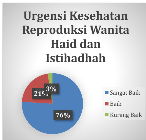
Gambar 3. Persentase tingkat pemahaman urgensi kesehatan reproduksi wanita haid dan istihadhah